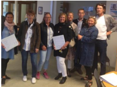
Fyrri námskeið fyrir kennara.

Kennurum var boðið upp á tvö námskeið í aðferðum Íslenskuþorpsins og einnig voru fundir þar sem farið var yfir hvernig gengi. Á námskeiðunum fengu kennarar tækifæri til þess að þjálfa sig í aðferðum Íslenskuþorpsins.