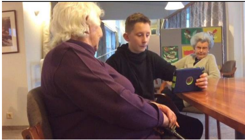
Samskipti í félagsmiðstöð aldraðra í Hæðargarði.

Nemendur lærðu betur á nærumhverfi sitt um leið og þeir æfðu sig í að tala íslensku. Þeir lærðu að nota samskiptaforrit og lærðu betur á spjaldtölvurnar sem þau fengu í hendur. Í verkefnum