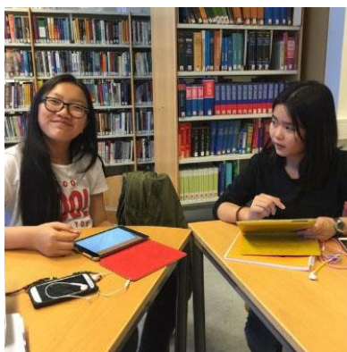
Nemendur hlusta á samskiptin og vinna verkefni.

Þrep 7: Nemendur fara aftur í fyrirtæki/staði og eiga samskipti.